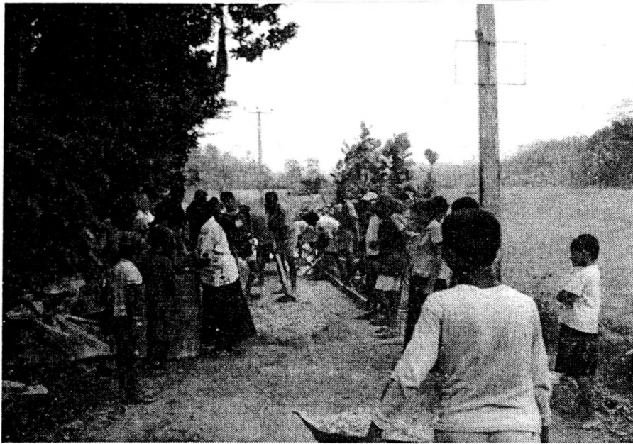
රූපසටහන් අංක 04

ආ. 50% ශ්‍රම දායකත්වය: කැඩී ඇති බෝක්කු, ගරා වැටී ඇති ගොඩනැගිල්ලකට, බස් නැවතුම්පොළකට අවශ්‍ය ද්‍රව්‍යය රජයෙන් ලබාගෙන 50% ශ්‍රම දායකත්වය මගින් මෙකී ව්‍යාපෘති නිමකෙරේ.