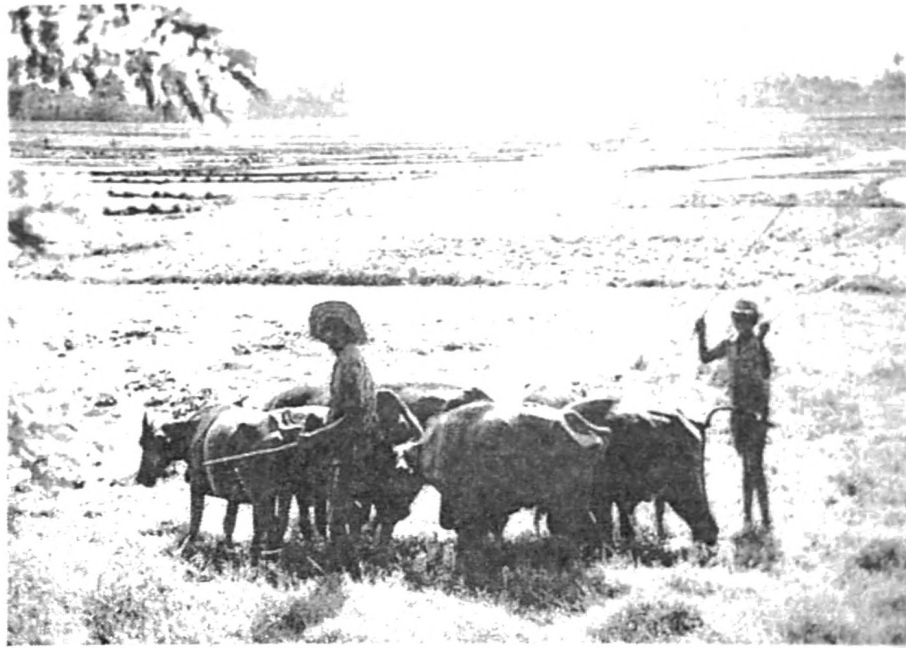
රූපසටහන් අංක 02

නිදහසින් පසු ශ්‍රී ලංකාවේ දිළිඳුකම පිටුදැකීම විෂයෙහි වැඩසටහන් කීපයක් ක්‍රියාත්මක විය. 1980 දශකයෙන් පසු දිළිඳුකම පිටුදැකීම අරමුණු කරගත් බොහෝ වැඩසටහන් සම්පාදනය වූයේ ව්‍යුහයාත්මක ගැලපුම් ප්‍රතිපත්ති මත පිහිටා ය. එකී වැඩසටහන් ලෙස, ජනසවිය වැඩසටහන හා සමෘද්ධි වැඩසටහන පෙන්වා දිය හැකි ය. මෙම වැඩපිළිවෙළවලින් පැවති දුර්වලතා හේතුවෙන් වර්තමානය තුළ හඳුනාගනු ලැබූ ග්‍රාමීය ප්‍රජා සංවර්ධන ව්‍යාපෘතියකි ගමනැගුම. ගම නැගුම ව්‍යාපෘතිය වූ කලී ග්‍රාමීය ප්‍රජාවගේ ආධ්‍යාත්මික මෙන් ම භෞතික සංවර්ධනය අරමුණු කොට 2006 වර්ෂයේ සිට ක්‍රියාවට නැගෙන වැඩපිළිවෙළකි. ග්‍රාමීය ප්‍රජාව සංවර්ධනයෙහි සෘජු කොටස්කරුවන් බවට පත්කර ගනිමින් ඔවුන්ගේ ස්වයං සංවර්ධනය ළඟා කරදීම මෙම ව්‍යාපෘතියෙහි මූලික අරමුණ වූ අතර,