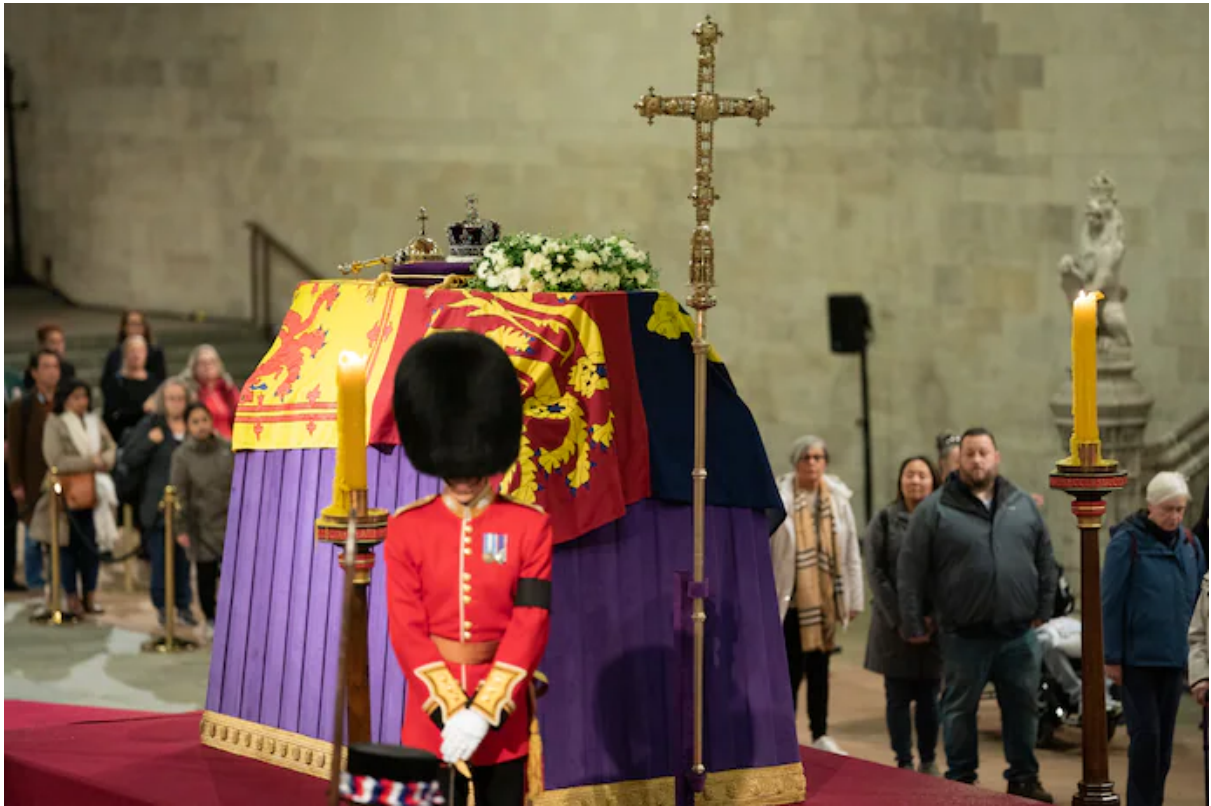
මූලාශ්‍රය: Brinkman (2022)

අර්බුද හා දේශපාලන යාතුකර්ම අතර සබඳතාද විශ්ලේෂණය කළ හැකිය. සිය ප්‍රතිවාදීන්, විශේෂයෙන් ත්‍රස්තවාදී හා වෙනත් සටන් කරුවන් වෙත “පොදු සමා කාලයක්” ප්‍රකාශ කිරීමද ලොව පුරා දේශපාලන රෙජිම අතර දැකගත හැකි යාතුකර්මයකි. සටන් පවතින අවස්ථාවල “නෝ මෑන් ඒරියා” ප්‍රකාශයට පත් කිරීම විශේෂයෙන් දේශ සීමා සම්බන්ධ සටන්වලදී දැකගත හැකිය. එසේම “දුග්ගැනවිලි ඉදිරිපත්කිරීමේ අවස්ථාවන්” (“Grievance-Venting”) හෝ “ඔම්බුට්ස්ඩමන්ටරයෙක්” පත් කිරීමේ ක්‍රියාවලි තුළද යාතුකර්මීය දිශානතීන් දැකගත හැකිය. මේවා යාතුකර්ම ලෙස ගත්විට සහභාගිවන්නන්ට පහසුවක් සැලසීමේ, ලිහිල් බවක හැඟීමක් ඇති කිරීමේ උත්සාහයක් මේවා තුළ දැකගත හැකිය. සෝවියට් සංගමයේ ලෙනින්වාදී අවධිය තුළ ගොවීන් වෙත යෝජනා කරන ලද සමූහ ගොවිපල ක්‍රම හා සමුපකාර ගොවිපල ක්‍රමද මෙවැනිම ආකාර සංක්‍රමණික යාතුකර්මයන්ය. එසේම දුග්ගැනවිලි ඉදිරිපත් කිරීමට අවස්ථාවක් ලබාදීම සෝවියට් රුසියාවද ඉඩම් ප්‍රතිසංස්කරණ තුළ දී ක්‍රියාත්මක කරනු අත්දැකිය හැකි විය. මෙය වාචික කරුණු දැක්වීම් මගින් ඉදිරියට යා හැකි ක්‍රමයක් ලෙස සලකනු ලැබිණි. චීන විප්ලවය තුළද මෙම යාතුකර්මීය ආකෘතිය යොදාගනු ලැබිණි. විශේෂයෙන් එහිදී මෙම දුග්ගැනවිලි හා කරුණු දැක්වීම් වාර්තා ගතකිරීම් නොකරන අතර වාචික මාධ්‍යය පමණක් භාවිත වීම සිදුවිය. වාර්තා ගත නොකිරීම රහස්‍යතාව ආරක්ෂා කිරීමේ ක්‍රමයක් ද විය (Fu, 2019).