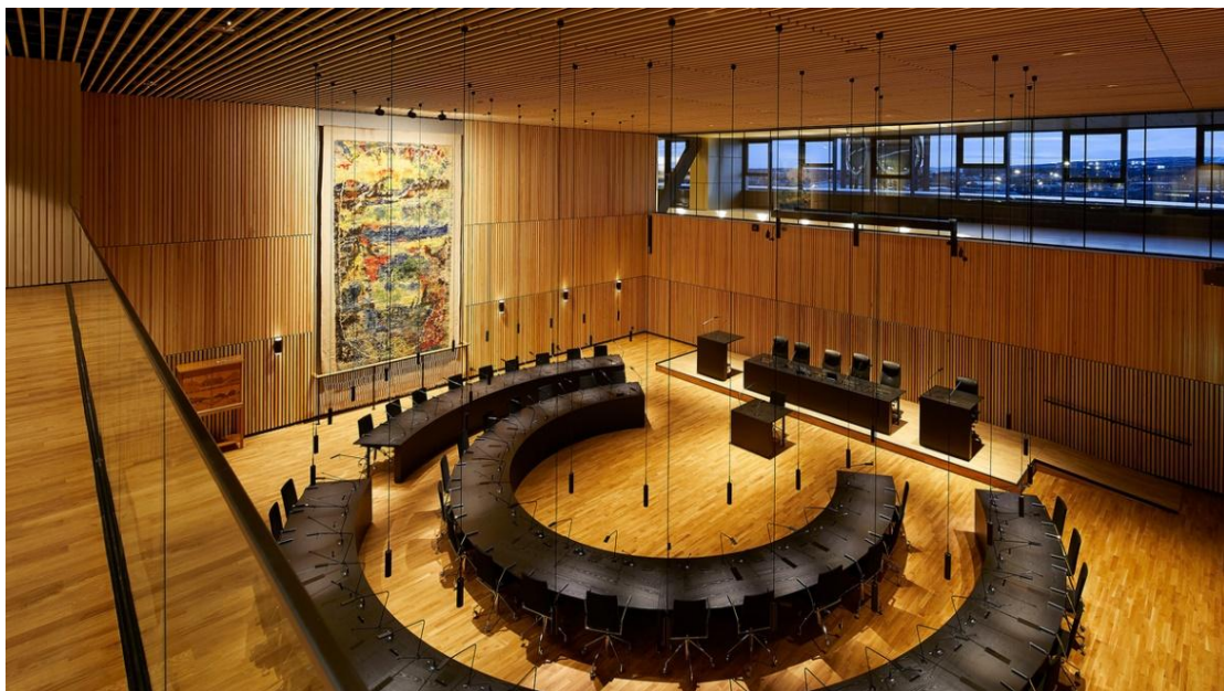
මූලාශ්‍රය: Kiruna City Hall - The Crystal Henning Larsen (n.d.)