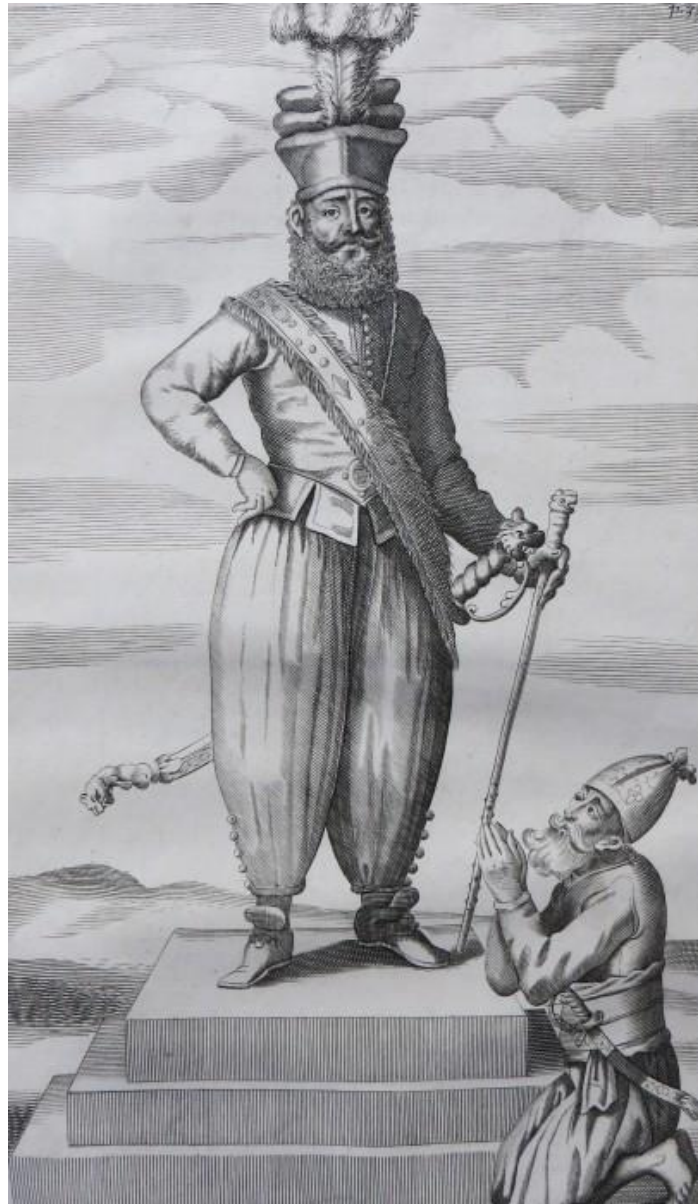
මූලාශ්‍රය: Knox (1681)

ශ්‍රී ලාංකේය දේශපාලනයද සංකේත හා යාතුකර්මවලින් දැඩි ලෙස සංයුක්ත වී ඇත. දේශපාලකයින්ගේ සාධක පැළඳීම සංකේතාත්මක දිශානතියක් මෙන්ම සුපුරුද්දක් ලෙස සිදුකිරීම තුළ යාතුකර්මීය දිශානතියක්ද දැකගත හැකිය. එකී සාධකවල පැහැයන්ගේ විවිධත්වය මගින් ඔවුන් විවිධ අන්‍යන්‍යතා මතුකරනු ලබයි. නවසිය පනස් ගණන්වලදී ලාංකේය දේශපාලනය තුළට පැමිණෙමින් තිබූ ජාති(ක)වාදී කතිකාව මගින් දැකගත හැකිවූ යාතුකර්මීය දිශානතියක් වන්නේ ජාතික ඇදුම එම දේශපාලන කණ්ඩායමේ සංකේතාත්මක හා යාතුකර්මීය පැවැත්මක් වූ ආකාරයයි. එය අද දක්වා අඛණ්ඩව පැවතෙයි. දේශපාලන රැස්වීම් තුළ ආසන පැනවීම තුළ ව්‍යවහාරවන යාතුකර්මීය දිශානතිය ඔස්සේ හුදෙක් එක් ඇස්බැල්මකින් එම උත්සවයේ තත්වානු පිළිවෙල ග්‍රහණය කර ගතහැකි වෙයි. මෙය පූර්වයටත්විජිත සමයේ පැවති කුල වැඩවසම් සමාජයේ පැවති තත්වානුගත ස්වරූපයේම දිගුවක් ලෙසද ගත හැකිය. මෙම ආසන පිළිබඳ සම්මතයන් රාජ්‍ය සේවය තුළද දැඩිව ක්‍රියාත්මක